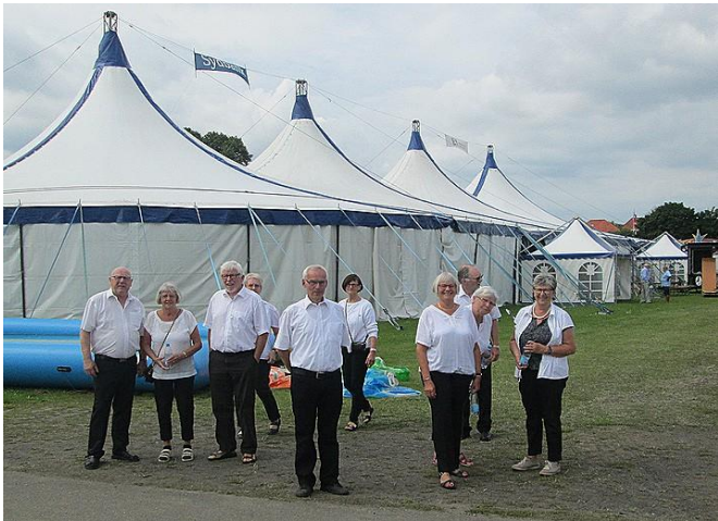
Serveringsholdet er klar.

Vore folk ydede atter en fremragende indsats om belønnes med et pænt bidrag til Skyttehusets pengekasse.