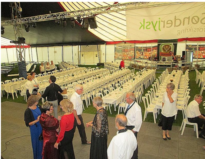
De flotte pyntede borde står klar.