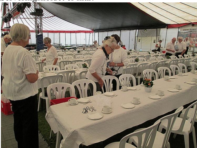
Så er vi i gang.