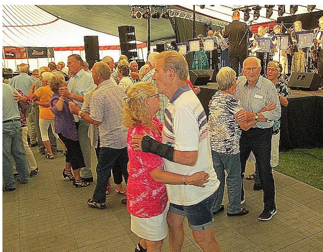
Til sidst blev der spillet op til dans.