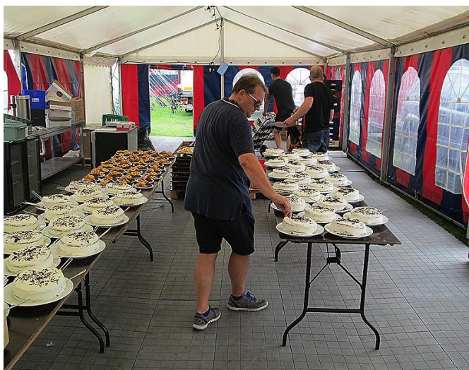
Køkkenteltet er klar med lækker brødtorte fra Kajs bageri.