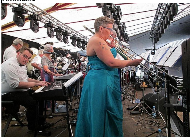
Fantastisk godt spillende orkester, som fik stemningen i vejret.