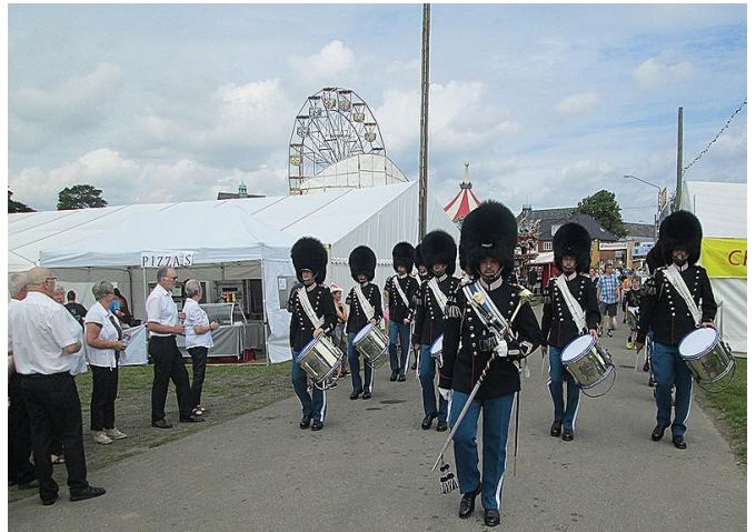
Nåede at få hilst på Livgardens tambourkorps .