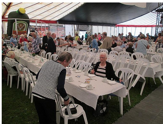
Teltet blev hurtigt fyldt op – næsten. 300 deltagere fyldte ikke meget i det store telt.