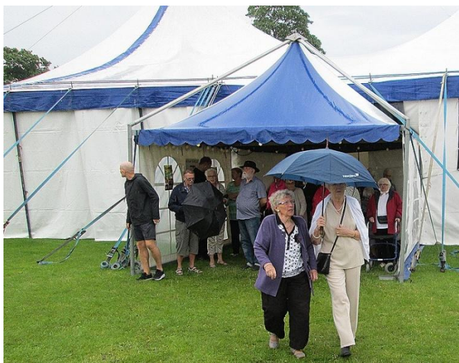
Udenfor var det blevet regnvejr.