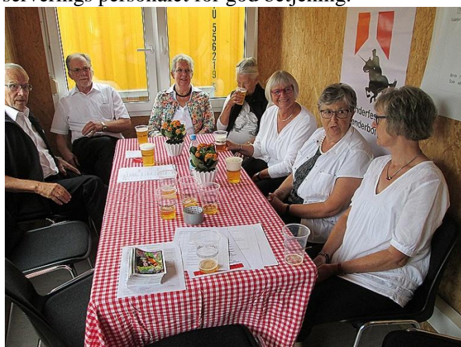
Serveringsholdet er klar igen næste år.

Arrangementkomiteen bød på en lille én eller måske 2. Det var fortjent efter en god indsats .