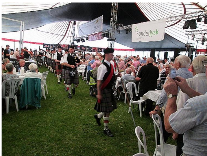
Sønderborg Pipes and Drums kom forbi.