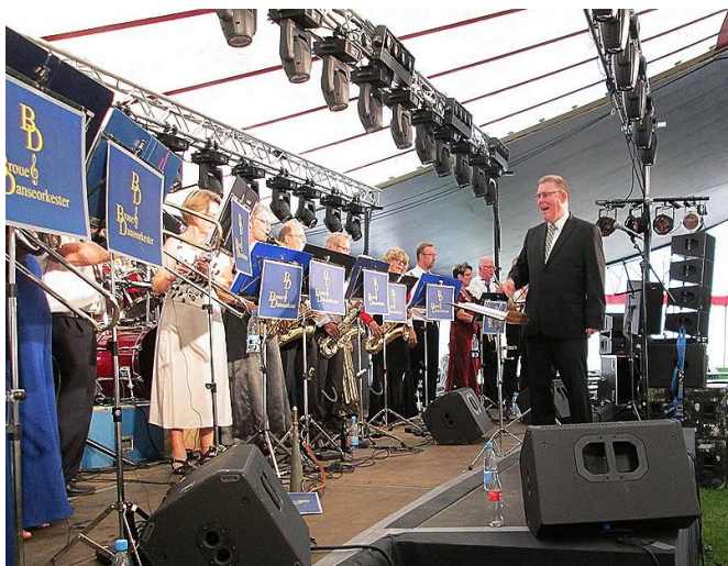
Broager Brandværens Danseorkester spiller op til polonaise