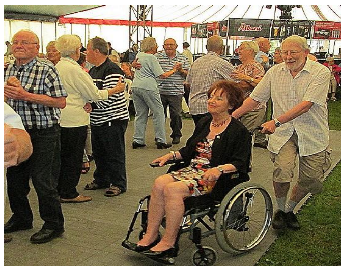
Hvor alle kunne være med.