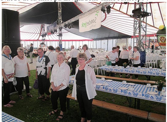
Nogle af vore kollegaer fra Sct. Georg Gildet.