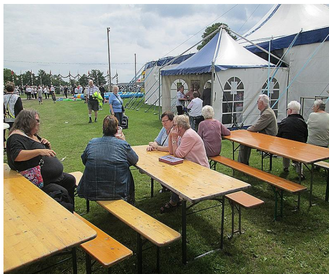
Flere venter forventningsfuldt udenfor.