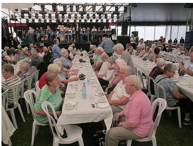
OK klubben var bredt repræsenteret.