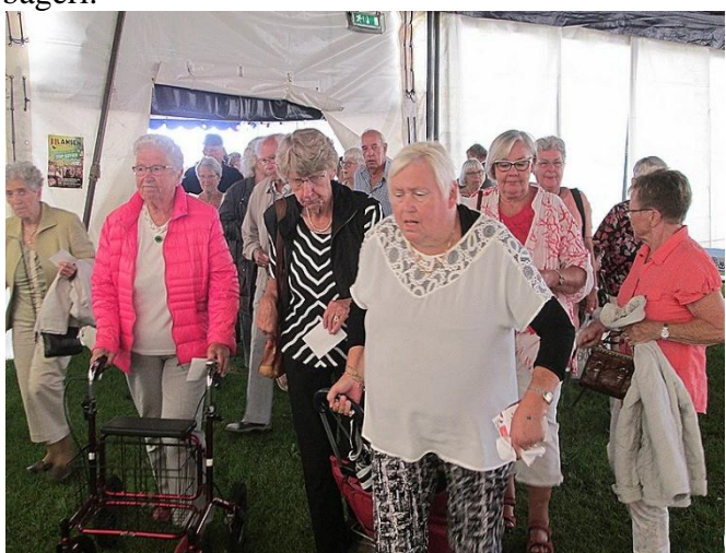
Trængsel for at få de bedste pladser.