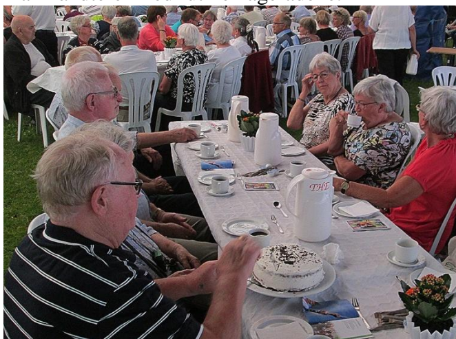
Så er der serveret.