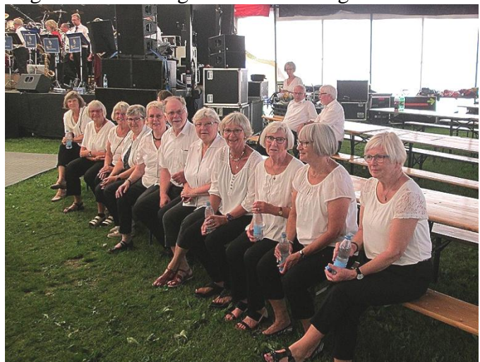
Et lille pusterum inden det går løs.