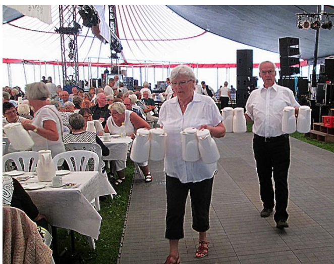
Så er kaffen klar. Det er med at holde tungen lige i munden, når der skal balanceres med 4 kander.