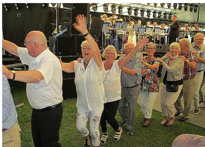
Vi har det, åh så dejligt.