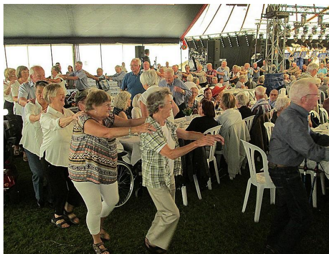
Det vakte jubel.