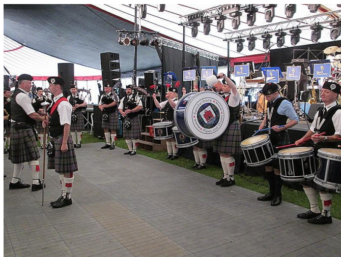
Highland Cathedral var naturligvis på programmet.