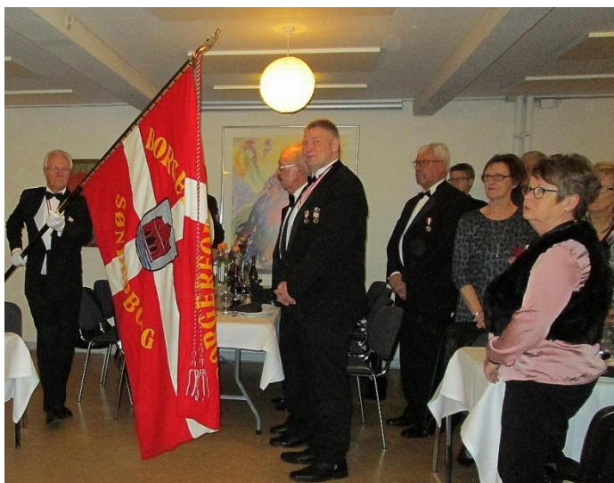
Fanen føres ind.