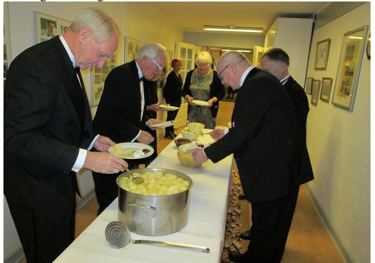
Hovedretten Kalvesteg stegt som vildt er klar.