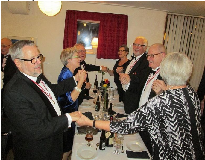
Det var starten på en forhøjet stemning.