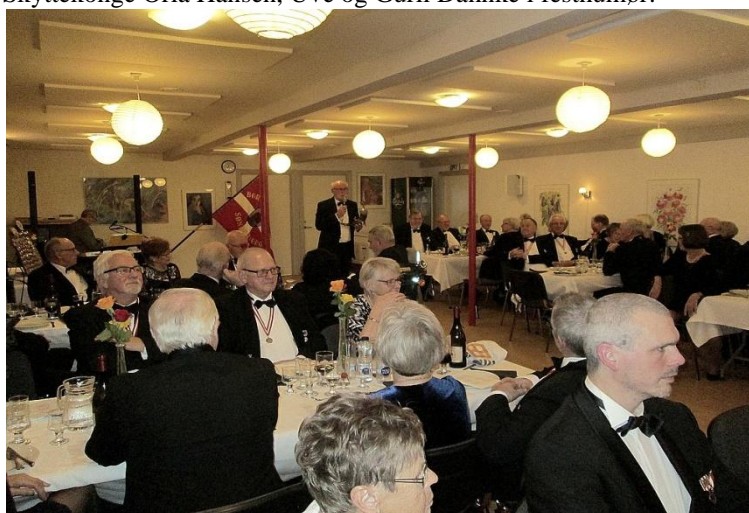
Grevinde Danners drikkehorn starter sin "vandring"