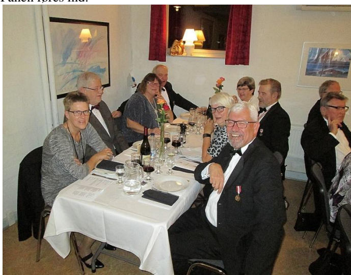
Begyndende god stemning.