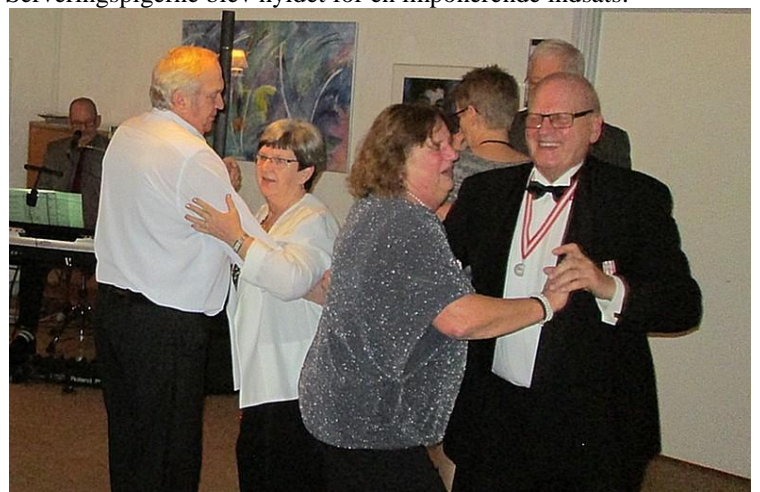
Har vi det ikke dejligt, jo.