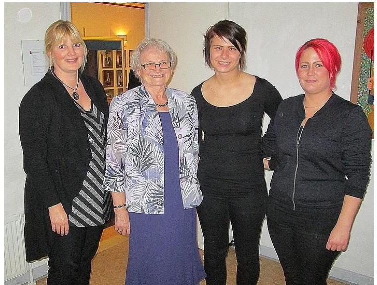
Serveringspigerne blev hyldet for en imponerende indsats.