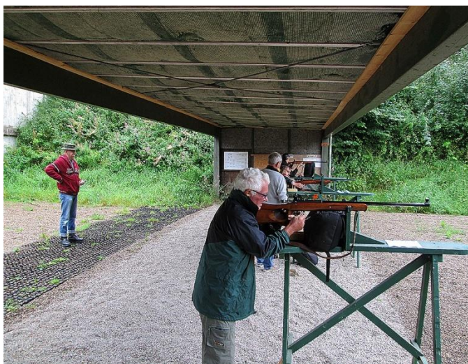
Der må skydes.