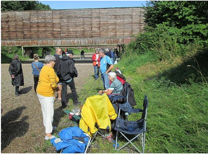
Ved start kl. 10.00. Flot solskin.