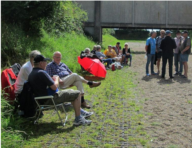
Det gode vejr kom heldigvis hurtigt igen.