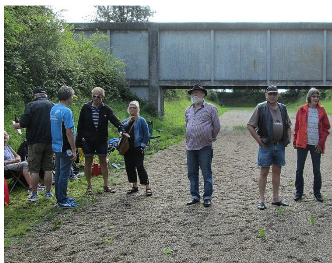
Interesserede tilskuere på ventelinien.