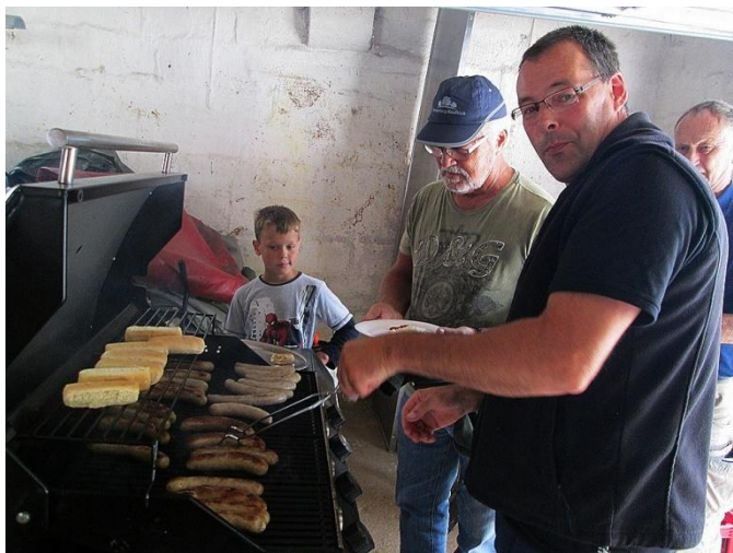
Så er der pølser