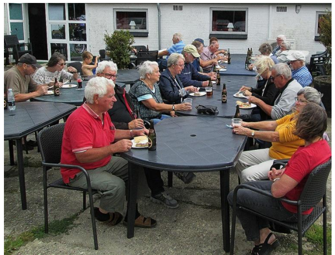
Fortsat godt vejr, men lidt blæsende.