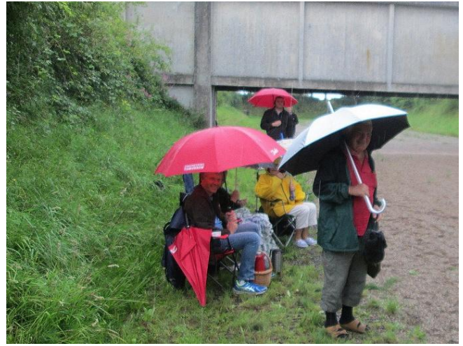
Men et par regnbyger kom lige forbi.