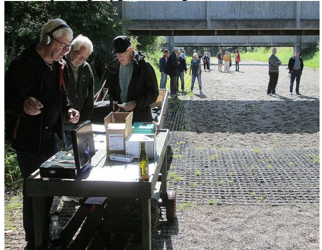
Jens Gøttler klarede indtegningen.