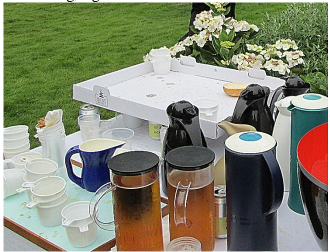
Tak for kaffe