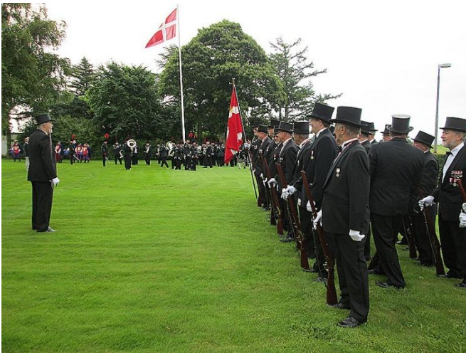
Alle er vel ankommet ind i haven.