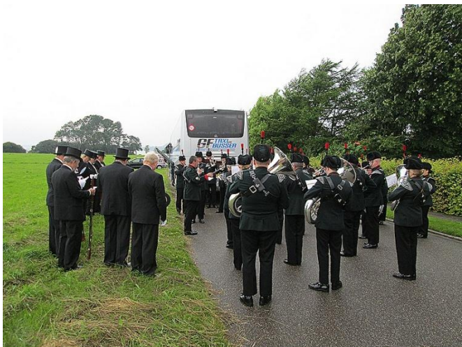
Slagsangen blev indøvet flere gange.

Ringriderfesten bød på kaffe og rundstykker samt et par drinks, mens snakken gik lystigt med en god blanding af dansk, engelsk og sønderjysk.