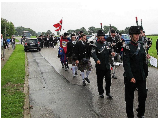
Orkestret gik ilmarch, så det kneb med at følge med.