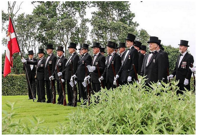
Skyttebrødrene sang deres slagsang i samspil med det store orkester. Lyt HER