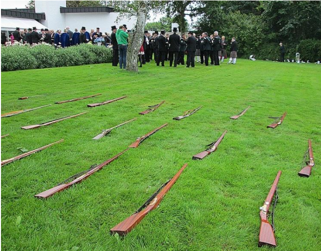
Så er der kaffe.