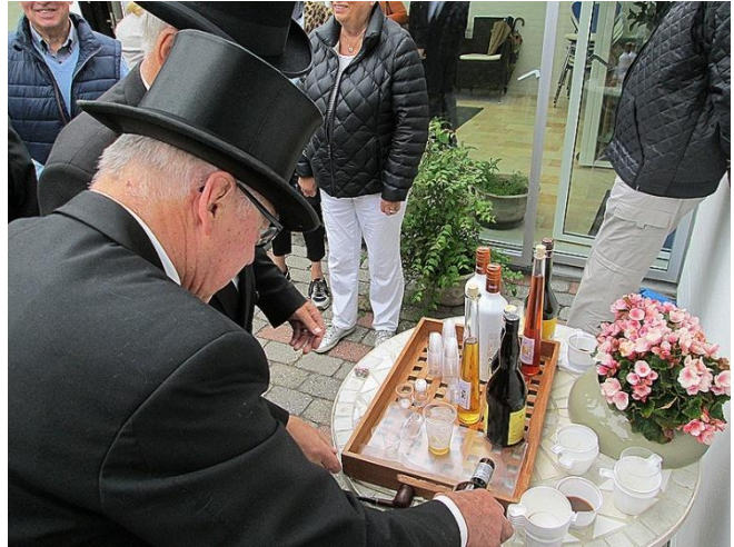
En enkelt gør godt.