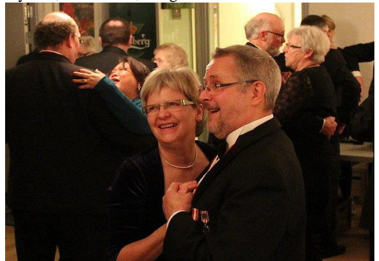
Dansegulvet blev hurtigt fyldt op