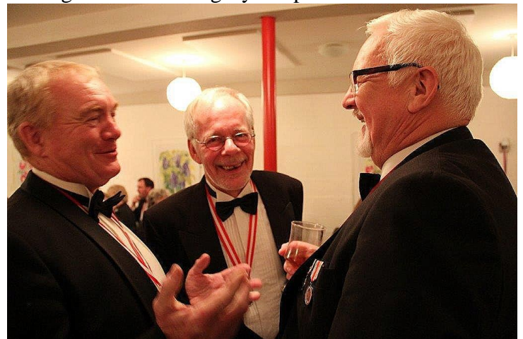
Lidt hyggesnak i krogene