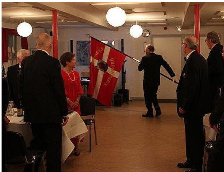
Fanen føres ind