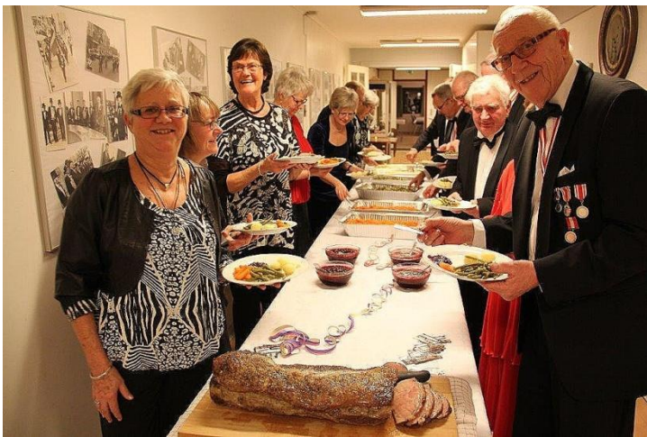
Så er der serveret