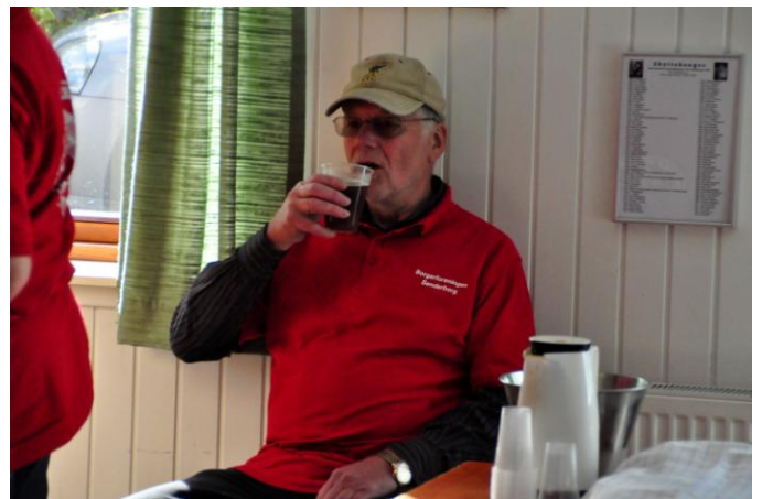
Efter dagens slid er det godt med en forfriskning.