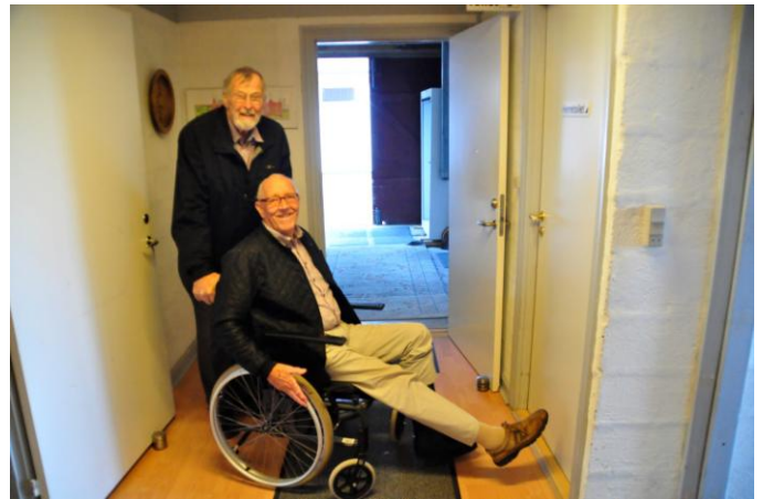
To "gamle" krigere i godt humør