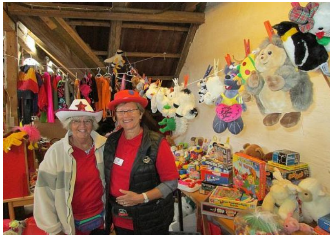
To elegante damer solgte legetøj