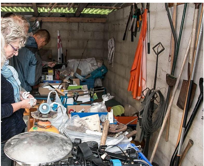
Også den nye værktøjsafd. Havde et godt salg.