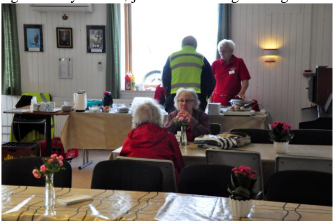
Den indvendige cafe var også populær.