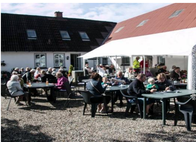
Der hygges på gårdspladsen