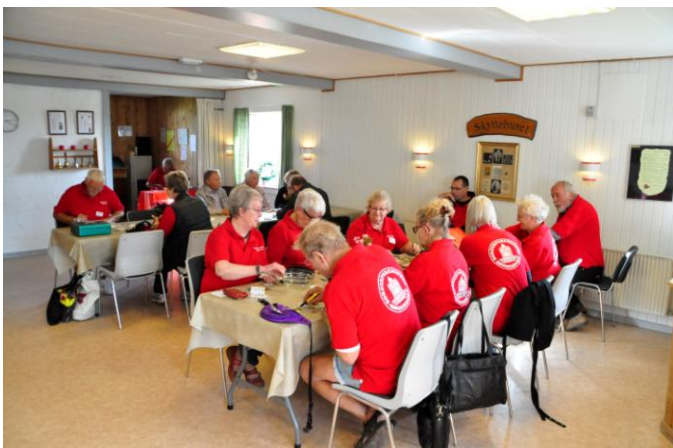
Omsætningen tælles op.