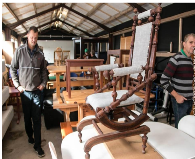
Møbler i stabelvis.