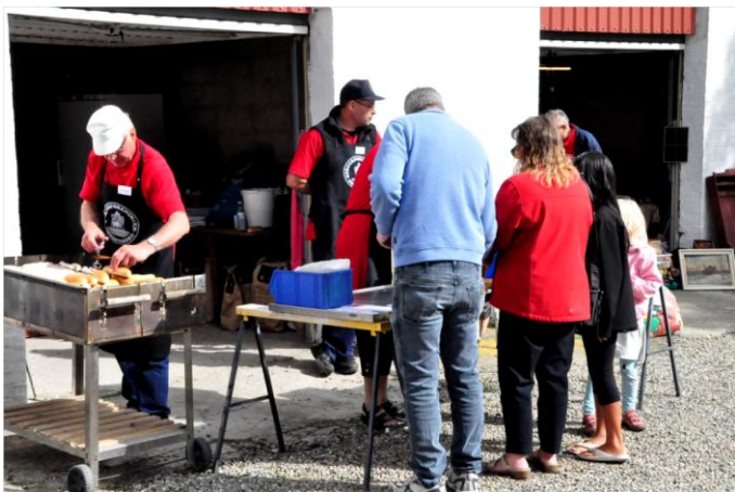
Der blev solgt grillpølser for 12.000 kr.