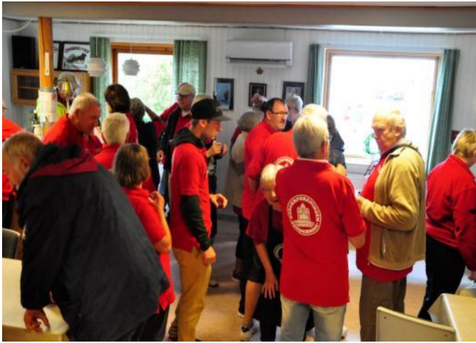
Alle mand er klar.