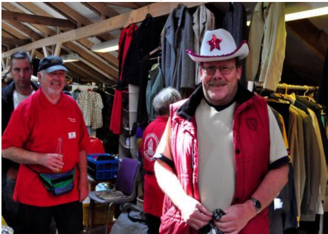
Skyttekongen Peter Dall i sit nye outfit.