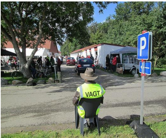
Da det endelig blev tørvejr strømmede folk til.