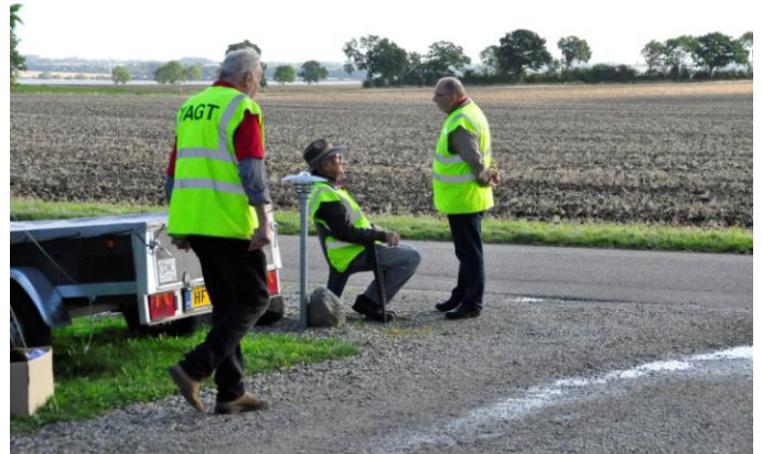
En P-vagts hårde job. Afløsning melder sig.