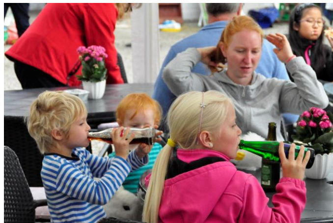
Også ungdommen hyggede sig.