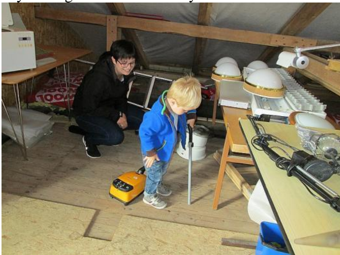
De yngste var også med til loppemarked.