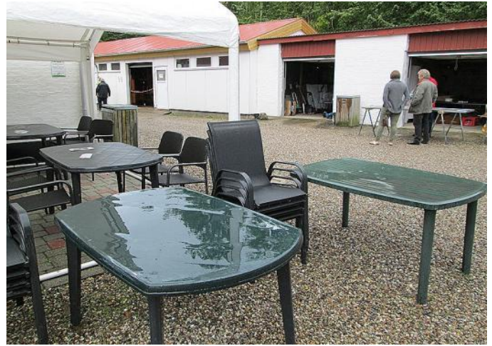
Lørdagen startede med regn