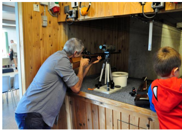
Mange skulle prøve lykken på skydebanen.