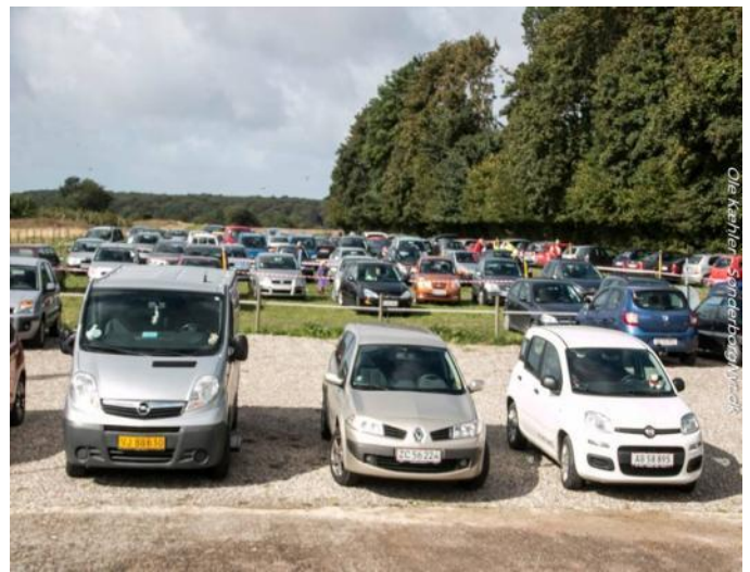
P-pladsen blev hurtigt fyldt op