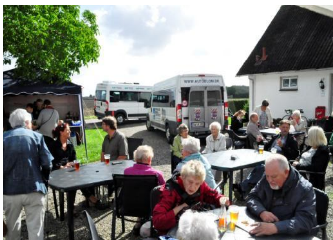
OK-Klubben kom på besøg i to busser.