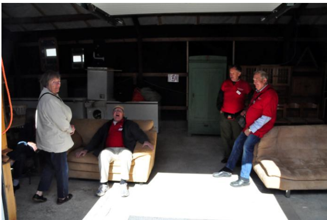
Puh-ha, rart med et hvil.