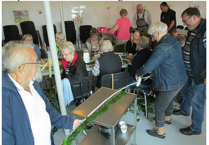
Sidste skulderkrans måles op