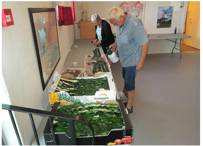
Der pakkes. Forrest står de lange skulderkranse