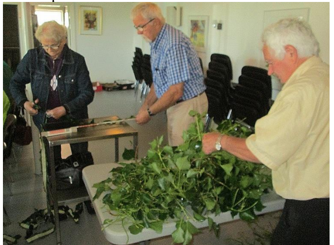
Der måles og klippes til