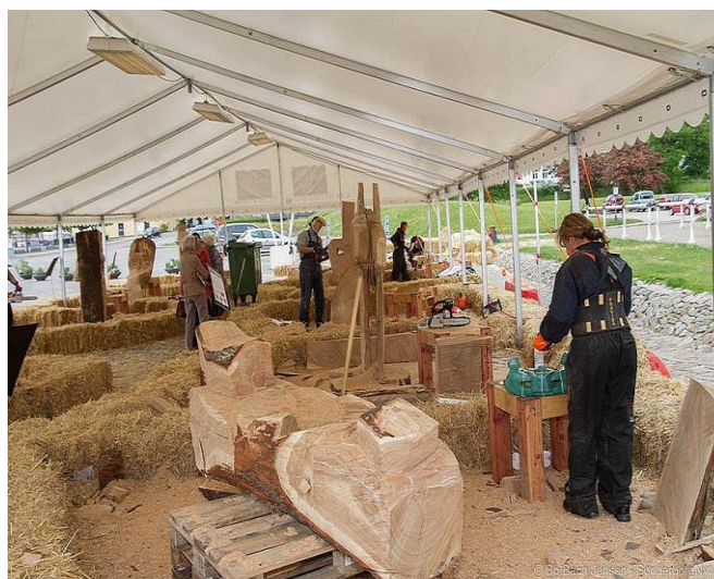
Også Borgerforeningens kunstværk.