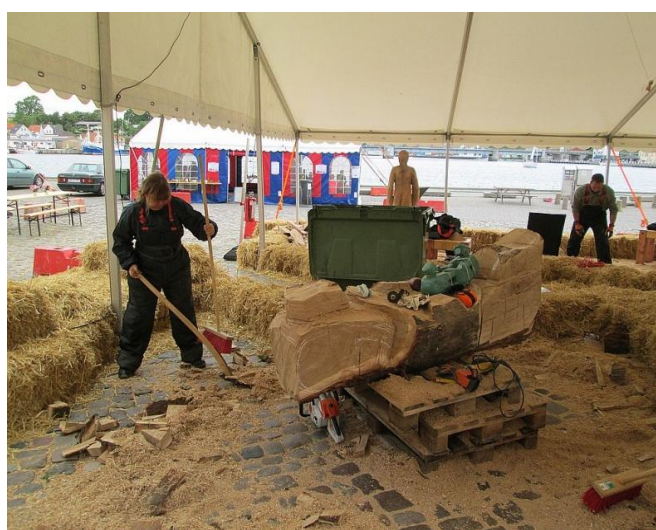
Lidt oprydning er nødvendig.