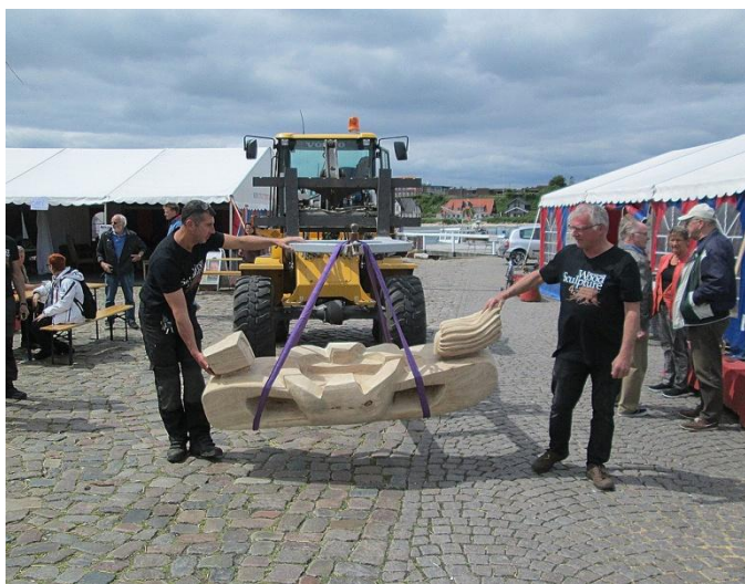
Med forsigtighed transporteres skulpturen bort.