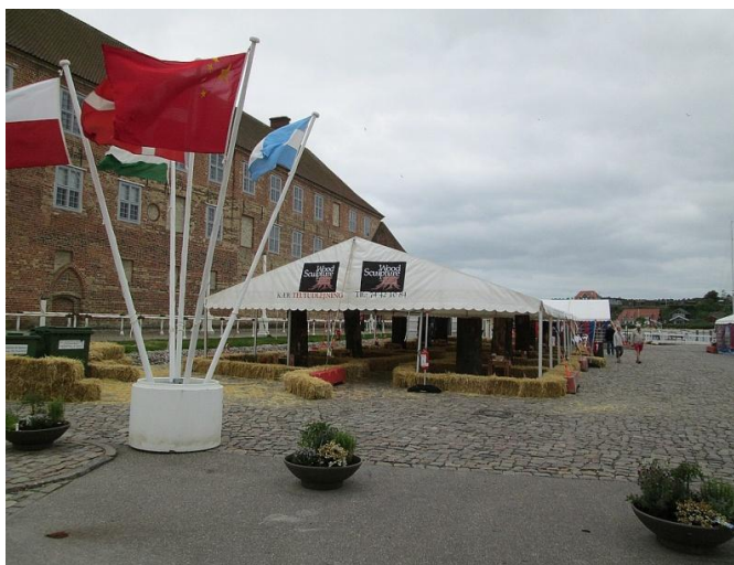
Stilhed før motorsavene kom i gang.