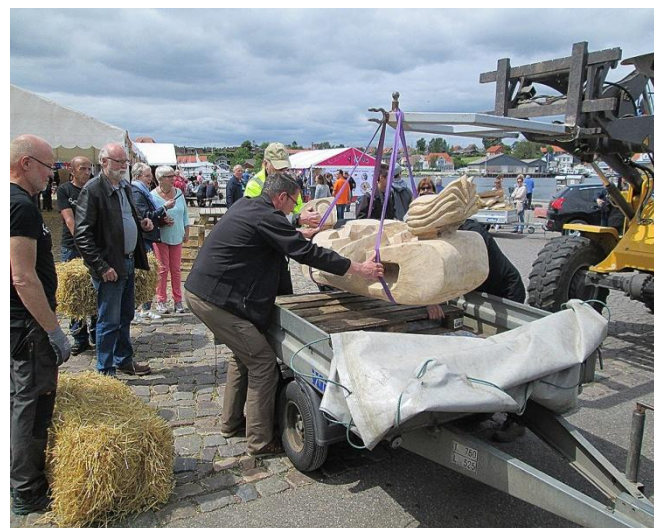
Næste stop er Skovhuse 11.