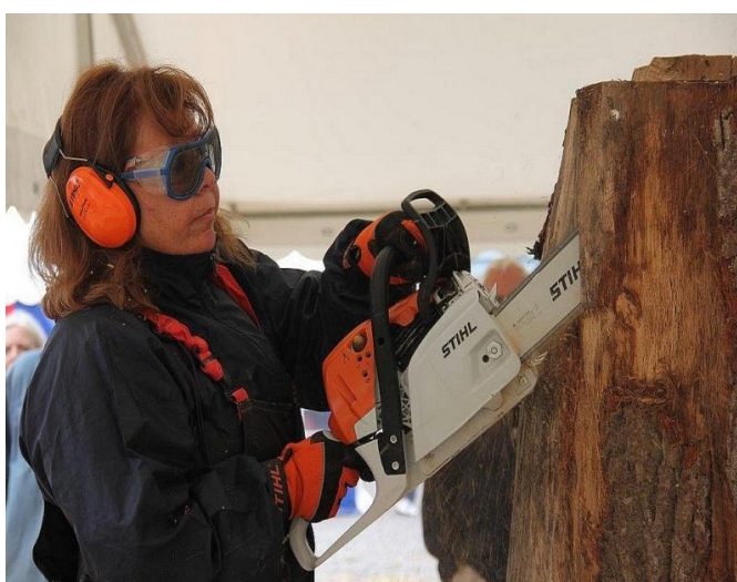
Det første snit