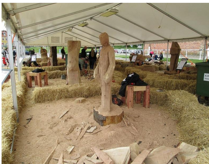
Skulpturerne tager form.