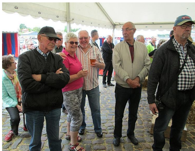
Flere af foreningens medlemmer så med.