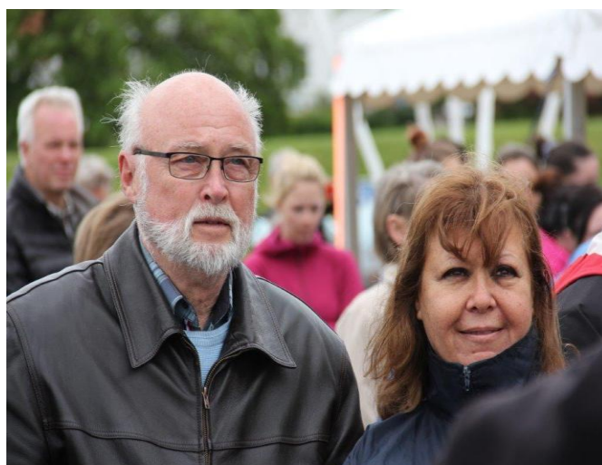
Formanden hilste på kunstneren.