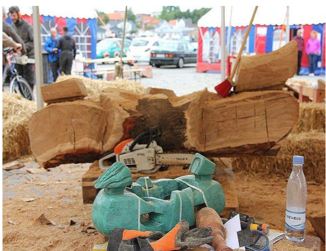
Den grønne genstand er en kopi af skulpturen.