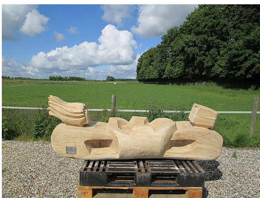
Hvor skal skulpturen mon have sin endelige placering?