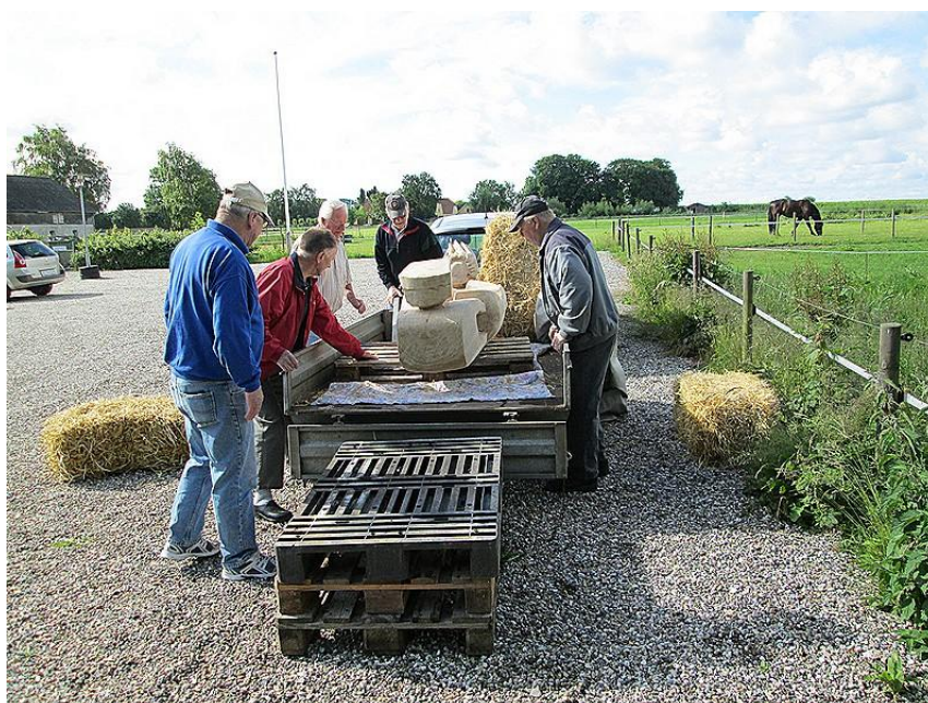
Skulpturen ankommer til Skovhuse 11