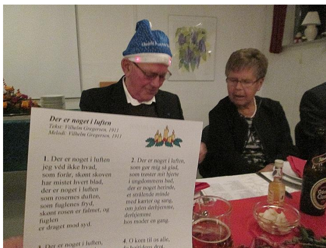
Der er noget i luften