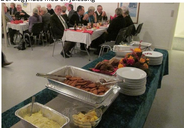
Så er maden klar