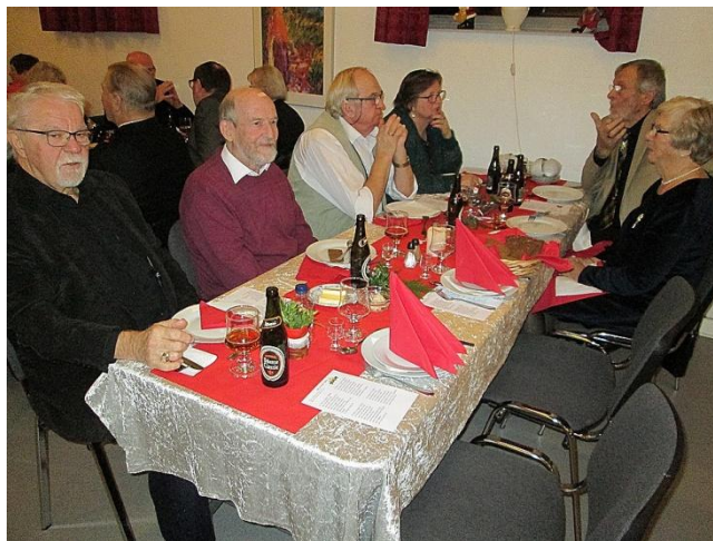
Mon vinderen skulle findes ved dette bord?