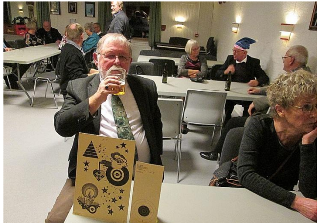
Der lades op til skydning