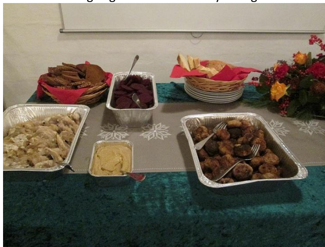
Klar til næste ret