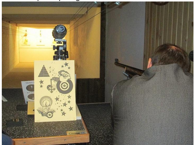
Juleskiven var drikk for mange