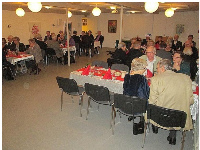
Alle gæster er på plads, klar til julefrokost