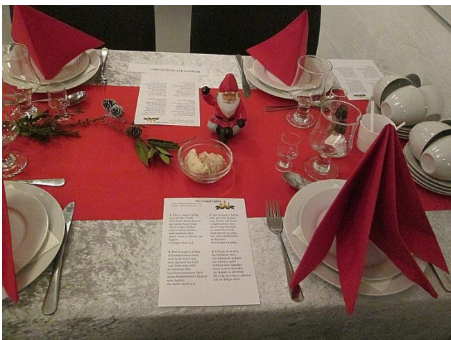
De flot pyntede borde