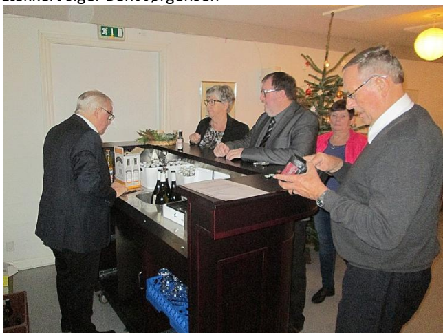
Baren er åbnet