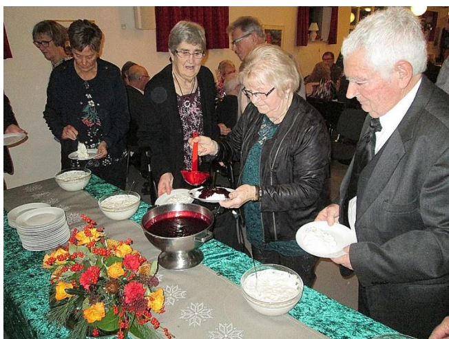
Så er der serveret ris à l'amande