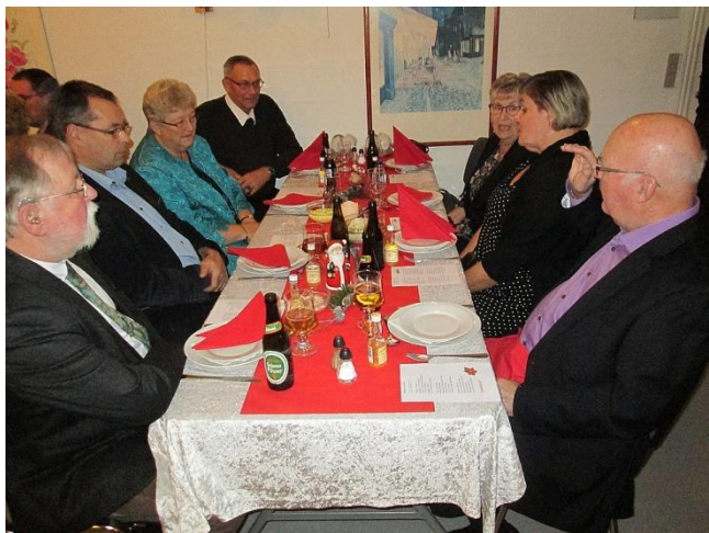
Der ventes spændt på maden