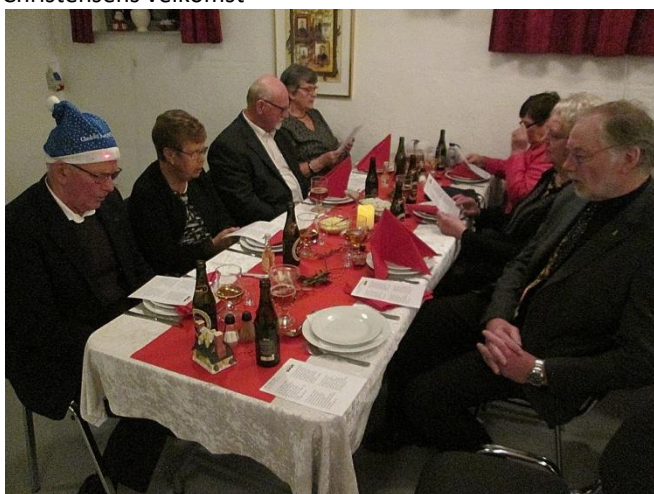
Der begyndes med en julesang