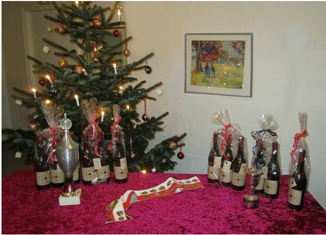
Præmierne præsenterede sig flot

Glædeligt, at flere nye medlemmer havde valgt at være med til frokosten.