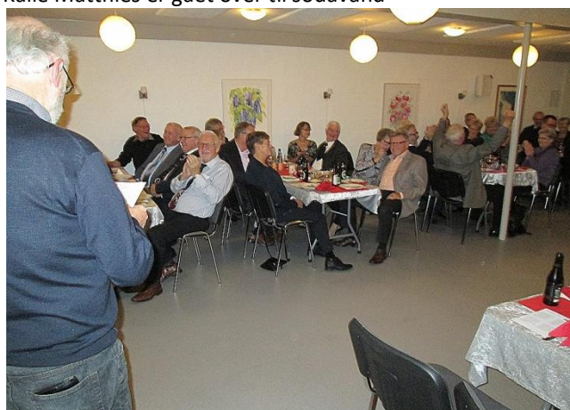
Tage fortæller hvem der vandt juleskydningen. Det vakte jubel blandt flere.